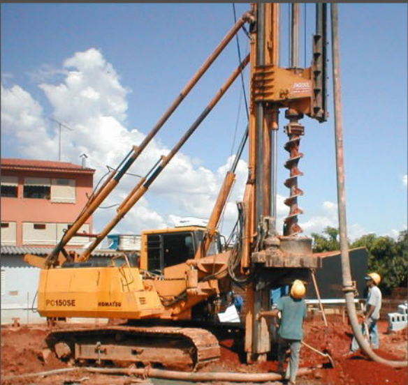
KOMATSU PC 150 SE