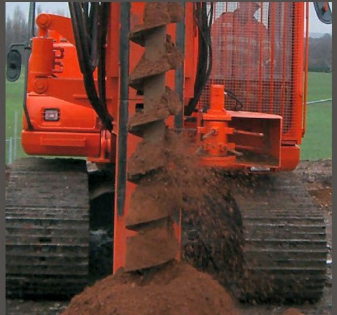
Auger cleaner - Limpador de hélice