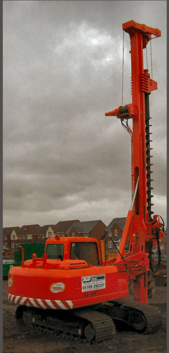
Operating in UK - Operando na Inglaterra