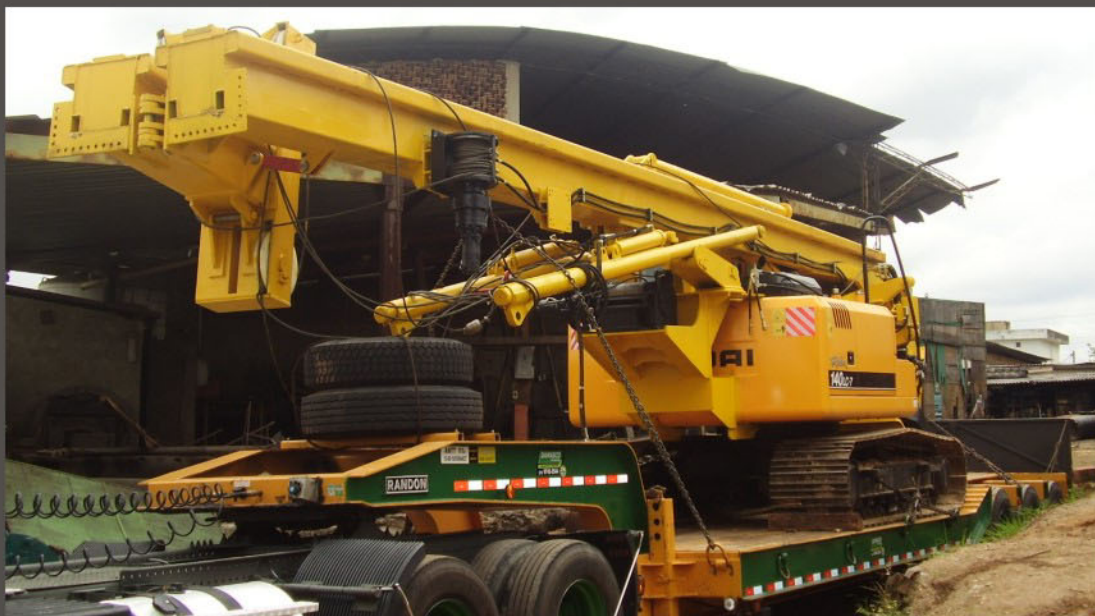
Easy to transport - Facilmente transportavel (Hyunday 140-LC7)